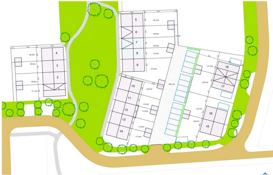
Situatie, stand van zaken november 2015