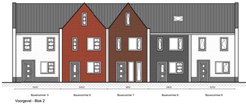
Gevelbeeld (schetsplan, stand van zaken nov 2015)